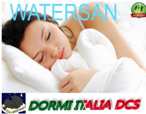
Aspetto generale vista prospettica