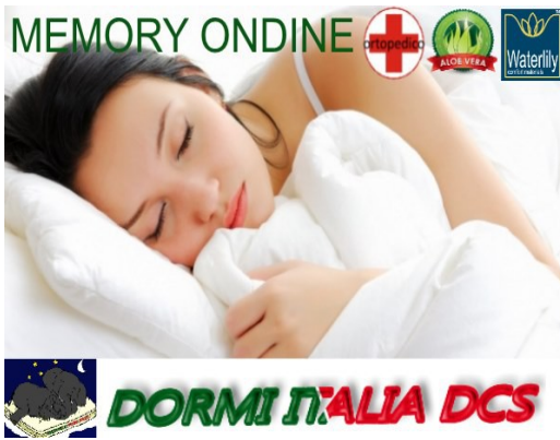
Memory Ondine - Aspetto finito